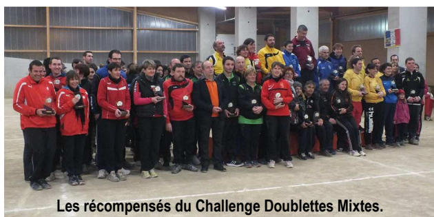
Les récompensés du Challenge Doublettes Mixtes.