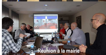
Réunion à la mairie