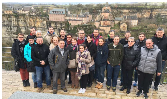
Les stagiaires Tronc Commun Instructeur Fédéral.

Nous espérons maintenant les accueillir à notre tour à Grenade pour le nouveau tournoi inter-club que nous allons lancer début Septembre 2016. Le bureau du SQSG.