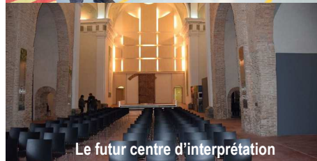
Le futur centre d'interprétation