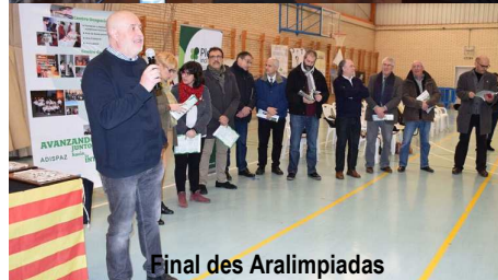
Final des Aralimpiadas