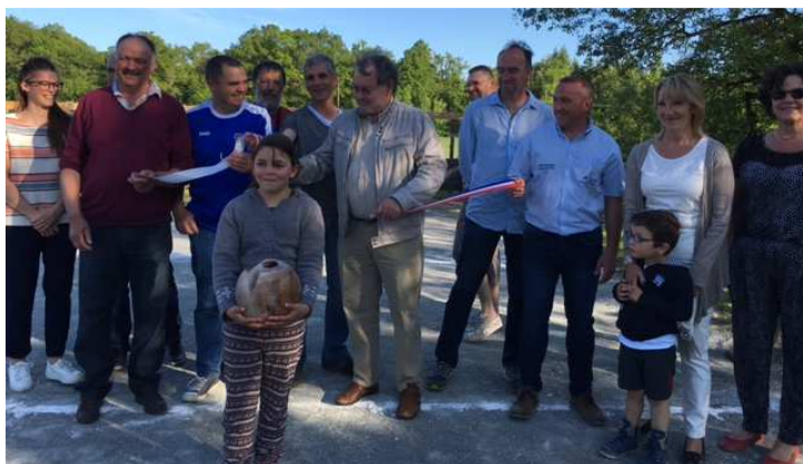
Sur les terrains de Najac : le ruban tricolore est coupé !