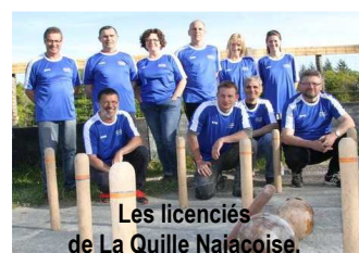
Les licenciés de La Quille Najacoise.

Des projets tels que l'intervention du conseiller technique dans les écoles de la commune, l'étude puis l'organisation d'un huitième de finale de Coupe de France sur la place centrale du village le 20 juillet (ce jour-là marché nocturne où près de 2000 personnes sont attendues) et bien d'autres manifestations autour des quilles prouvent, s'il le fallait, l'engagement des responsables du club dans le développement de la pratique des quilles de huit.