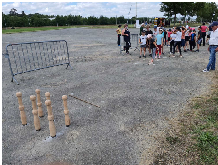
Le dernier groupe de la journée au Quilles au Maillet.

L'aventure continue, puisque avec le projet au Garros mercredi prochain à 14H30, nous aurons l'occasion d'ébaucher la participation de ces jeunes au championnat de France et mettre en place les détails de la mise en œuvre.