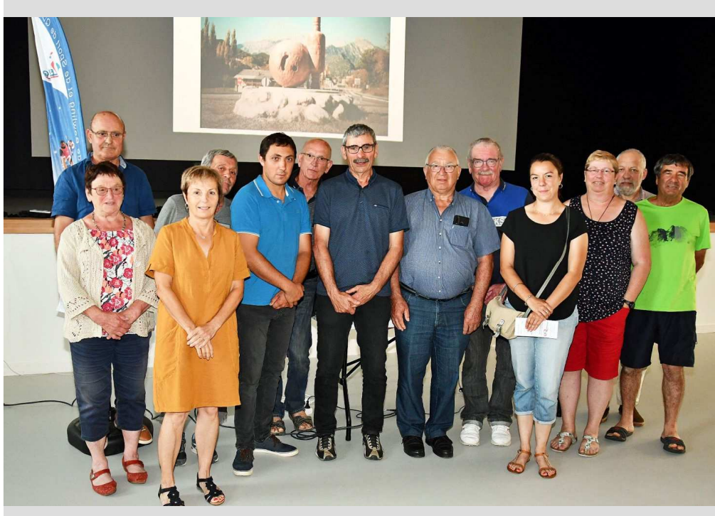
Les membres de la commission avec les organisateurs de L'école de Quilles de l'Adour.