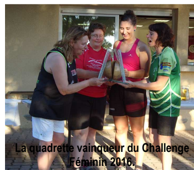
La quadrette vainqueur du Challenge Féminin 2016.

La finale s'est déroulée à Grenade et ce fut l'occasion pour le club de Save/Garonne, en présence des élus (municipaux et départementaux) et du Comité National, de recevoir le diplôme de labellisation de son école de quilles. Voir le palmarès de l'édition 2016 ci-dessus. Si vous aussi, vous voulez faire partie de l'aventure 2017, n'hésitez pas à nous contacter ! jeromeloubi@yahoo.fr