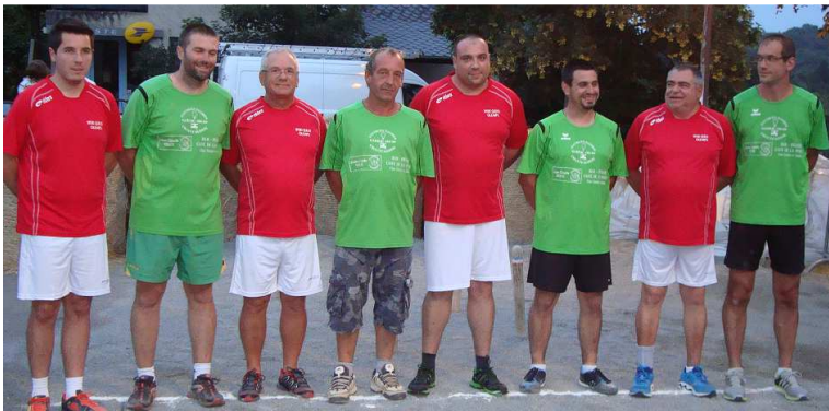
Olemps et Villecomtal à Najac.