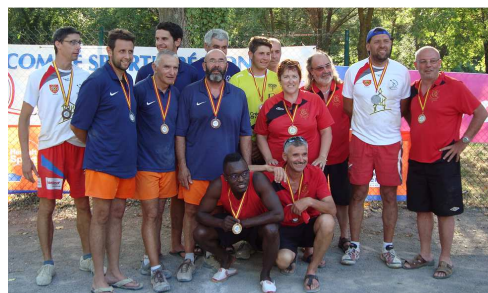
Les récompensés de l'individuel Grand Sud.

Dimanche 10 juillet a eu lieu le championnat individuel Grand Sud où les joueurs des clubs hors Aveyron se sont retrouvés pour cette compétition qualificative pour le championnat de France individuel. Beaucoup de chaleur, de convivialité, un bon repas mais aussi et surtout de bonnes performances tout le long de cette journée. Malgré les distances importantes pour se rendre à Montpellier, 50 joueurs se sont disputé les médailles et la qualification dans les différentes catégories soit autant que les années passées ; la motivation reste intacte, c'est très bien et bravo à tous les participants. Un petit regret toutefois, c'est l'absence de deux ou trois joueurs au moment de la remise des prix mais il est vrai que le soir même il y avait une autre finale avec un ballon rond... Un grand remerciement bien sûr, aux arbitres et aux officiels qui ont parfaitement encadré le déroulement de cette journée." R. Prat