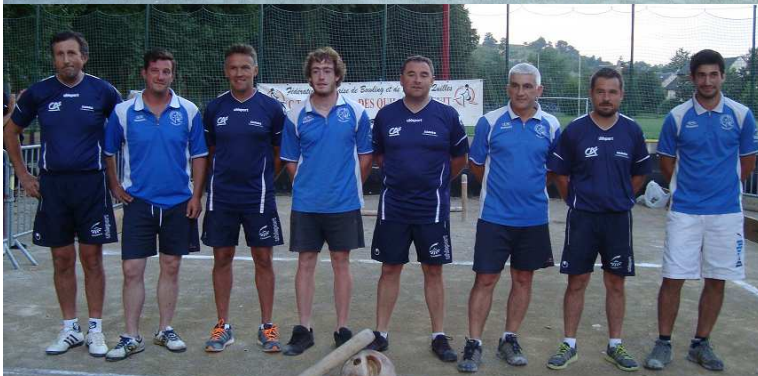
Sainte Geneviève et Moyrazès à Espalion.