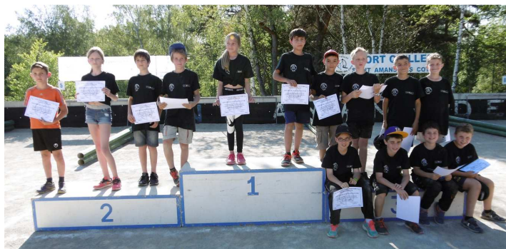
Les récompensés de l'épreuve de la Quille d'Or.