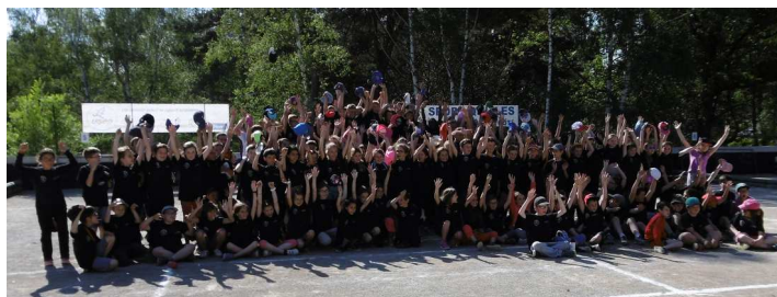
Les élèves réunis pour la photo souvenir.