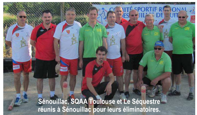
Sénoillac, SQA Toulouse et Le Séquestre réunis à Sénoillac pour leurs éliminatoires.

C'est sous un soleil radieux (enfin !!) que s'est déroulé le dimanche 26 juin, sur le quillodrome de Senouillac, la sélection pour représenter Midi-Pyrénées à la Coupe de France 2016. Les clubs du Séquestre, de Senouillac et du Sqaat avaient accepté de relever le défi pour cette première édition. Bravo au SQ.Senouillac (R.Miquel, P.Albouze, P.Azema, C.Miquel) qui a remporté la compétition et qui représentera la région le 10 août à Rignac. JL Tarroux