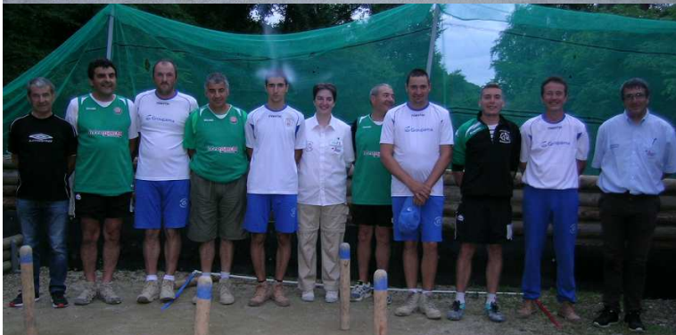
Bozouls et St Amans à Entraygues.