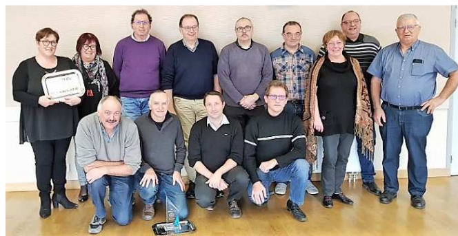
Le Comité Directeur du CSR Occitanie.