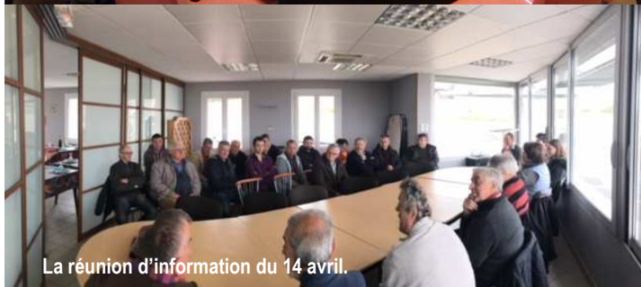
La réunion d'information du 14 avril.