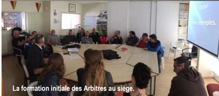
La formation initiale des Arbitres au siège.