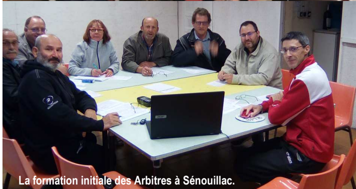
La formation initiale des Arbitres à Sénouillac.