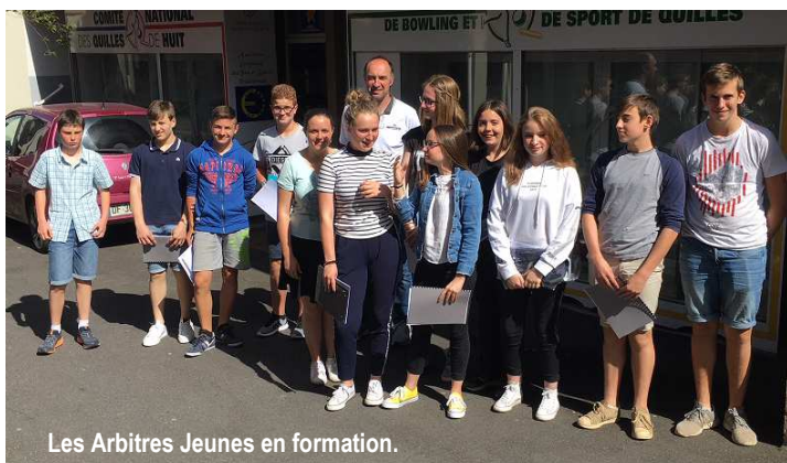
Les Arbitres Jeunes en formation.