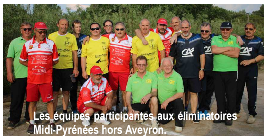
Les équipes participantes aux éliminatoires Midi-Pyrénées hors Aveyron.

Coupe de France : C'est le club de Castres qui a organisé le tour de qualification à la Coupe de France. Les parties se sont déroulées le vendredi 18 mai et pour cette première compétition organisée par le club de Castres, nous pouvons féliciter Frédéric et tous les membres du club pour le bon déroulement de cette soirée. Quatre équipes se sont affrontées sportivement pour déterminer le club qui aura le privilège de participer à cette compétition nationale. C'est la quadrette de Sénouillac avec un score de 9 points qui a été déclarée vainqueur devant Castres (7 points), Save Garonne (5 points) et Le Séquestre (3 points). Merci à tous les joueurs et bonne chance aux qualifiés.