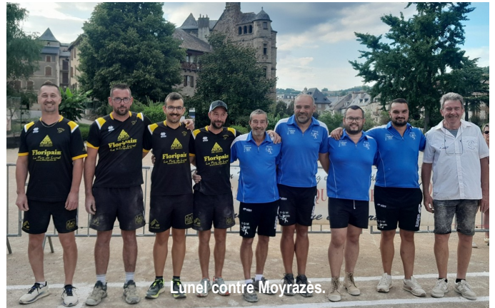
Lunel contre Moyrazès.