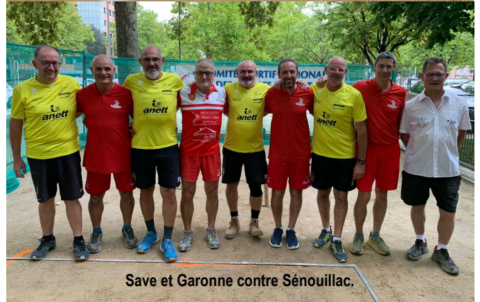
Save et Garonne contre Sénouillac.