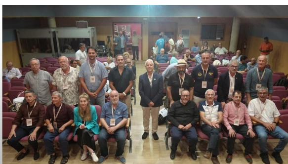
AEJeST Council Board 2025-2029