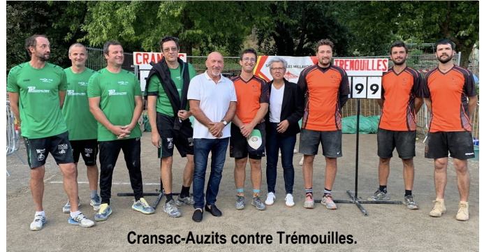
Cransac-Auzits contre Trémouilles.