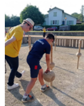
Quilles de 9