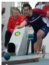
Ninepin bowling schere