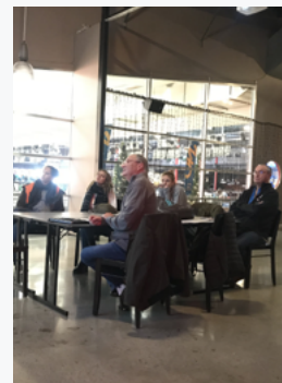
Formation en salle