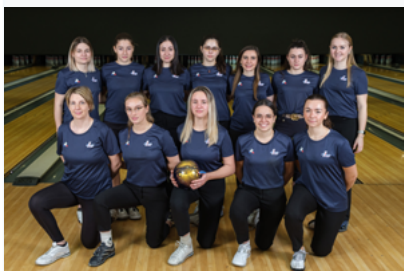
EDF Dames 2022 - 2023