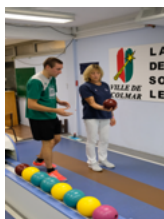
Ninepin bowling classic