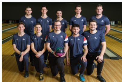
EDF Hommes 2022 - 2023