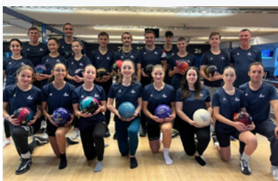
EDF Jeunes U19 2022 - 2023