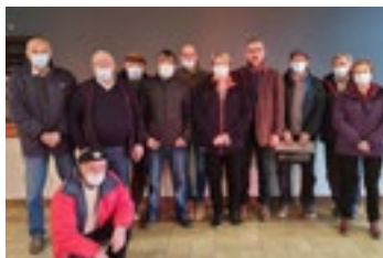
Photo de l'équipe dirigeante: