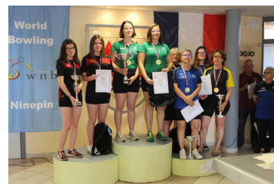
Un des Podiums Championnats de France Tandem-Sprint

Les Championnats de France par équipes se sont déroulés les 4 et 5 juin 2022 sur le quillier du complexe sportif de BEINHEIM dans le Bas-Rhin.