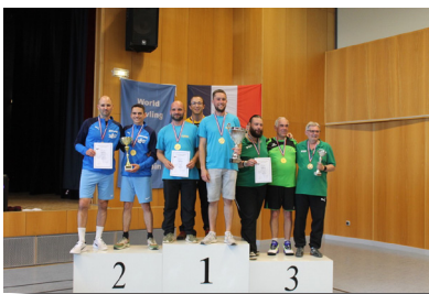
Un des Podiums Championnats de France par Équipes